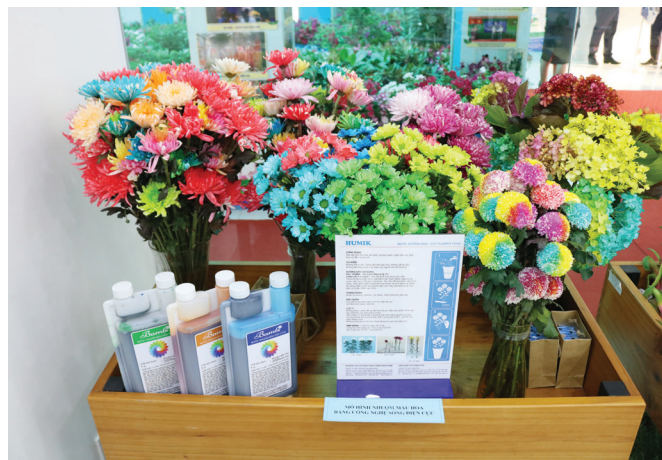
Sản phẩm nông nghiệp công nghệ cao của TP.HCM trưng bày tại một sự kiện xúc tiến thương mại và đầu tư do ITPC tổ chức.

- Tổ chức chuyên thăm và làm việc giữa các đơn vị khởi nghiệp, các bộ phận phụ trách khởi nghiệp, đổi mới sáng tạo với các nhà đầu tư uy tín; tập đoàn công nghệ