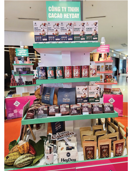
Sản phẩm chế biến từ nông sản xuất hiện ở các sự kiện xúc tiến thương mại do ITPC tổ chức tại TP.HCM.