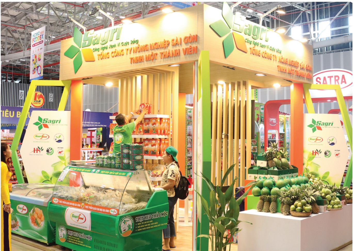
Các sản phẩm của Tổng công ty Nông nghiệp Sài Gòn (Sagri) tại Hội chợ Foodex 2023 do ITPC tổ chức. Đây là hội chợ thương niên được đánh giá là sự kiện xúc tiến thương mại uy tín trong lãnh vực lương thực - thực phẩm quy tụ nhiều doanh nghiệp lớn trong nước và quốc tế.

- Tạo động lực khuyến khích doanh nghiệp, các tập đoàn đổi mới sáng tạo và nghiên cứu công nghệ ứng dụng trong nông nghiệp để kết nối mạng lưới khởi nghiệp đổi mới sáng tạo quốc gia góp phần nâng cao năng lực cạnh