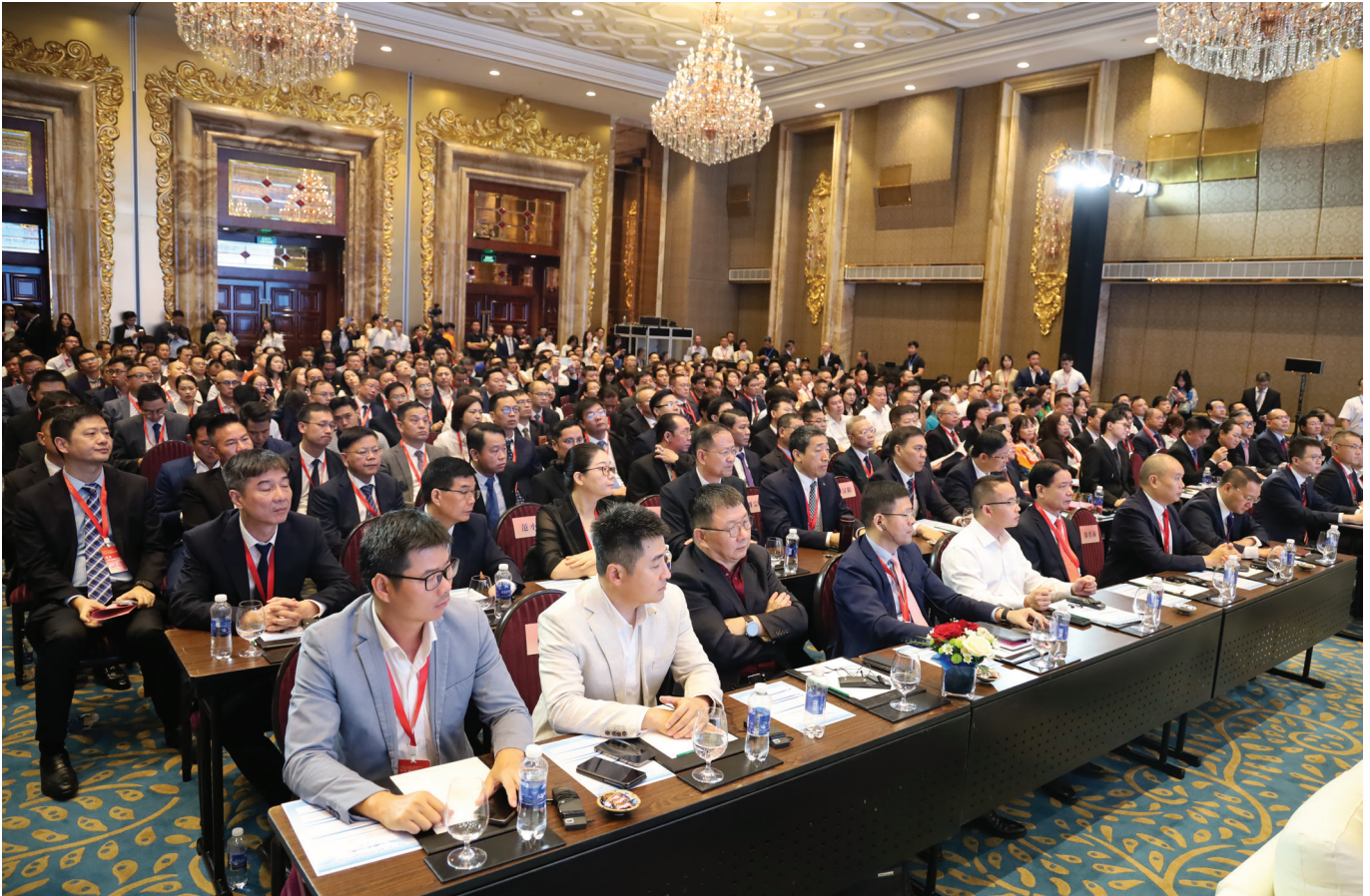
Hội nghị thu hút hơn 350 đại biểu tham dự.