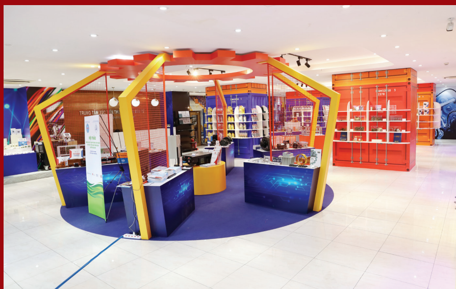
Tuần lễ kết nối giao thương và giới thiệu sản phẩm ngành cơ khí, công nghệ số, điện và điện tử năm 2024

Liên hệ: Phòng dịch vụ - ITPC Điện thoại: (028) 39104903 (028) 39104039 (028) 38222 983 (028) 39104947 Email: bizcenter@itpc.gov.vn; Website: www.itpc.hochiminhcity.gov.vn vexa.vn