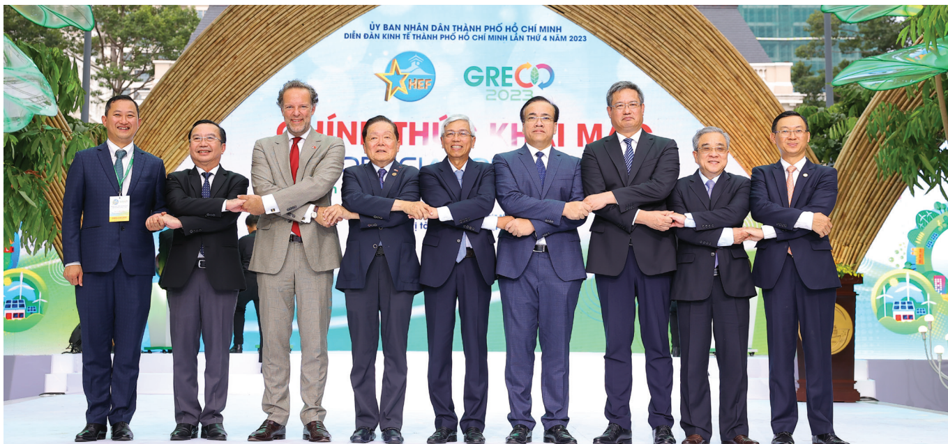
Lễ khai mạc Không gian triển lãm sản phẩm dịch vụ tăng trưởng xanh (Greco 2023) do ITPC tổ chức nằm trong Diễn đàn Kinh tế TP. Hồ Chí Minh lần thứ 4 năm 2023 (HEF 2023) với chủ đề “Tăng trưởng xanh – Hành trình hướng tới giảm phát thải ròng bằng không”.