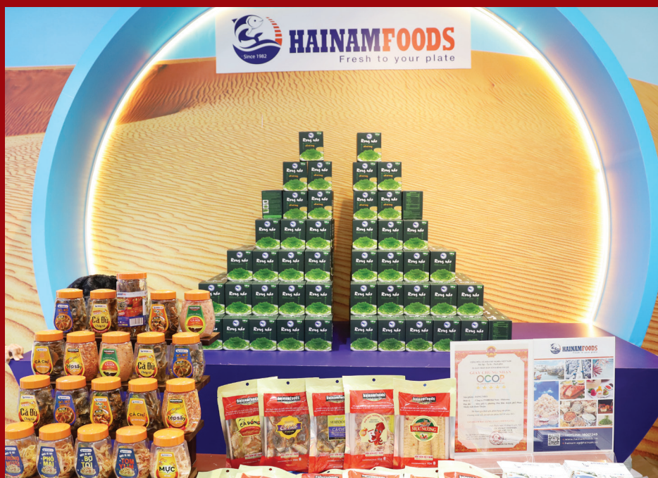
Tuần lễ triển lãm sản phẩm đặc trưng, sản phẩm OCOP tỉnh Bình Thuận năm 2024

ĐIỂM ĐẾN của doanh nhân, doanh nghiệp - nơi tổ chức chuyên nghiệp, hiệu quả các sự kiện xúc tiến thương mại và đầu tư.