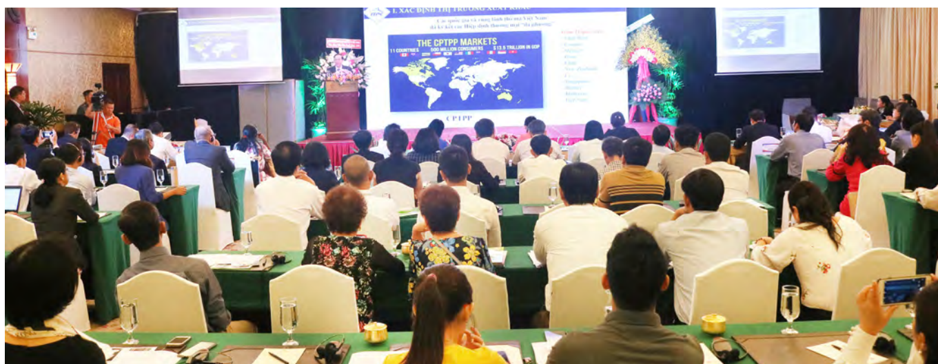
Diễn đàn Xuất khẩu 2019