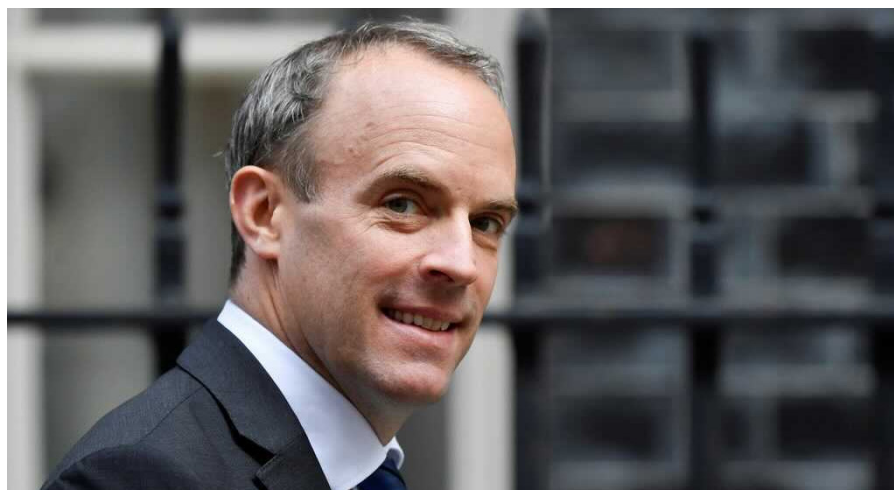
Ngoại trưởng Vương quốc Anh Dominic Raab

Anh hy vọng sẽ tăng cường hợp tác kinh tế với các quốc gia châu Á - Thái Bình Dương và mở rộng thương mại ra ngoài châu Âu sau Brexit. Việt Nam đã thông qua thỏa thuận thương mại tự do với EU vào tháng Sáu và EVFTA đã chính thức có hiệu lực từ tháng Tám. Nếu không có