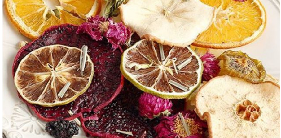
Sản phẩm trái cây khô của Việt Nam được bán trên trang alibaba.com.

E-commerce chính là xu hướng thương mại đang phát triển, với các mô hình chi tiết được áp dụng ngày càng rộng, nhất là ở khu vực châu Á. Người tiêu dùng có nhiều lựa chọn trong việc mua hàng vì họ có mối quan tâm và hành vi khác nhau rất rõ nét. Với việc người tiêu dùng xem trạng thái ở nhà tương đương với ở ngoài nhà và việc họ chú trọng vào chất lượng mặt hàng, e-commerce có tiềm năng trở thành công cụ đặc lực