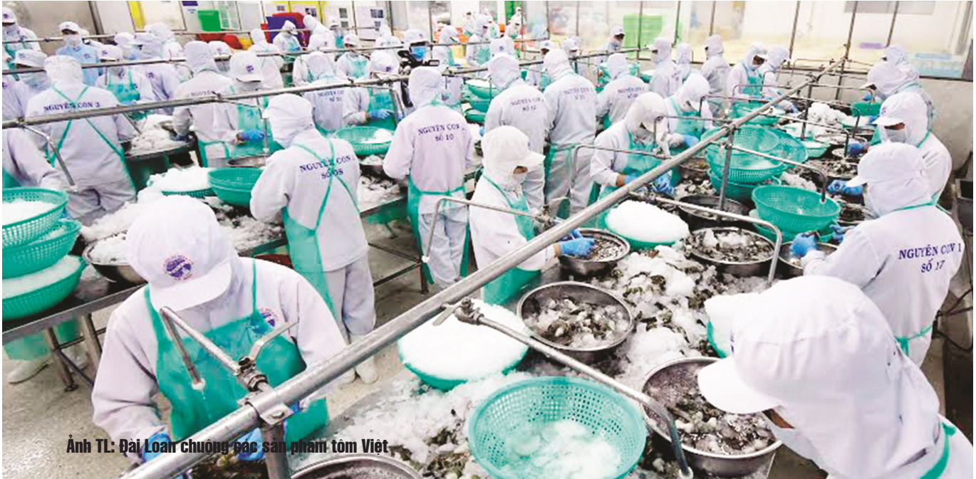
Đài Loan chương các sản phẩm tôm Việt

T heo VASEP, hiện Đài Loan không nằm trong top 10 thị trường nhập khẩu thủy sản của Việt Nam. Dù vậy thị trường này lại có kim ngạch nhập khẩu thủy sản từ Việt Nam tương đối ổn định với trên 100 triệu USD/năm, chiếm từ 1,3 - 1,8% tổng giá trị xuất khẩu thủy sản của cả nước. Ước tính trong 6 tháng đầu năm nay, xuất khẩu thủy sản sang Đài Loan đạt 50,5 triệu USD. Trong đó, xuất khẩu tôm đạt 27 triệu USD; cá tra đạt gần 10 triệu USD, các mặt hàng hải sản đạt 22 triệu USD.