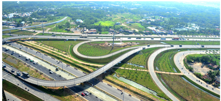
Thành phố Thủ Đức được kỳ vọng sẽ có đóng góp quan trọng trong sự phát triển chung của TP.HCM trong thời gian tới.

Ý tưởng lập Thành phố Thủ Đức (Thành phố phía Đông) được chính quyền TP HCM hình thành gần 10